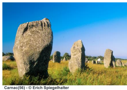
Carnac(56) - © Erich Spiegelhalter

Profitez également de votre séjour pour découvrir Pontivy et son imposant château .... Une escapade Morbihannaise ne serait pas complète sans une visite de Carnac et de ses sites mégalithiques.