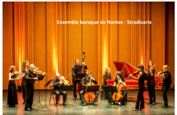
Ensemble baroque de Nantes - Stradivaria